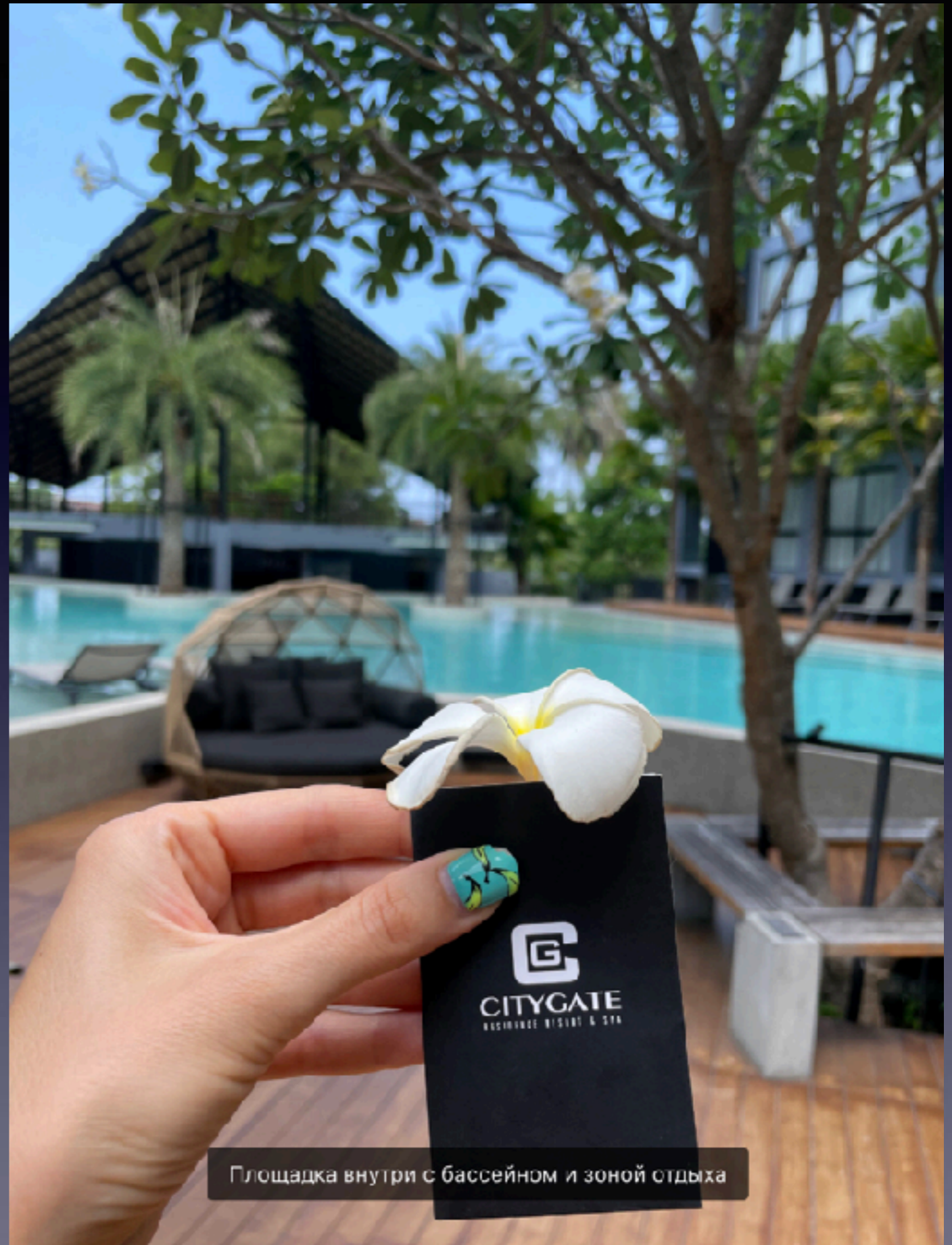
Площадка внутри с бассейном и зоной отдыха

Нажмите, чтобы узнать подробнее об объекте.